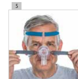
Ajuste también las cintas inferiores para la cabeza de forma que queden tan flojas como sea posible, pero proporcionando la necesaria sujeción.