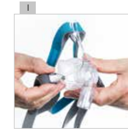
Suelte los dos clips de la máscara.