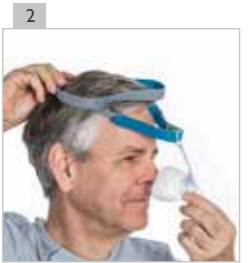
Colóquese las cintas en la cabeza.