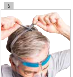
Ajuste la cinta en la cabeza de modo que no choque abajo con los lóbulos de las orejas.