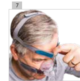
Ajuste el soporte frontal lo más flojo posible, ya que no debe apretar.