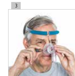
Fije los clips en la parte inferior de la máscara.