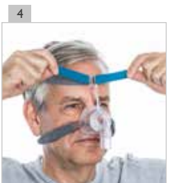
Ajuste también las cintas superiores para la cabeza de forma que queden tan flojas como sea posible, pero proporcionando la necesaria sujeción.