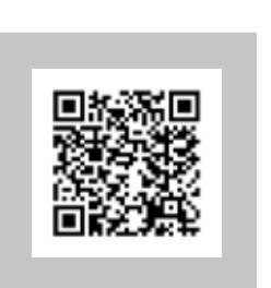
Encontrará nuestro vídeo para usuarios en YouTube.