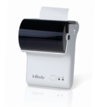
▶ Impresora Térmica